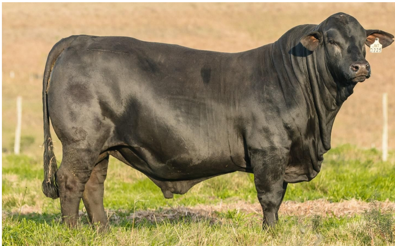
LOTE 40 - JMT D225 "JOHN" – Melhor Índice Final do 18º Leilão JMT, TOP 1% da raça.