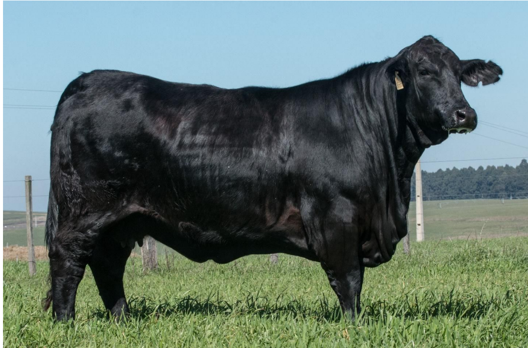
JMT NANDA 9898 – Grande Campeã Expointer 2016, Miss South América e 2ª Melhor Vaca Brangus do Mundo – Irmã paterna dos lotes 41, 4, 5, 6 e muitos outros.