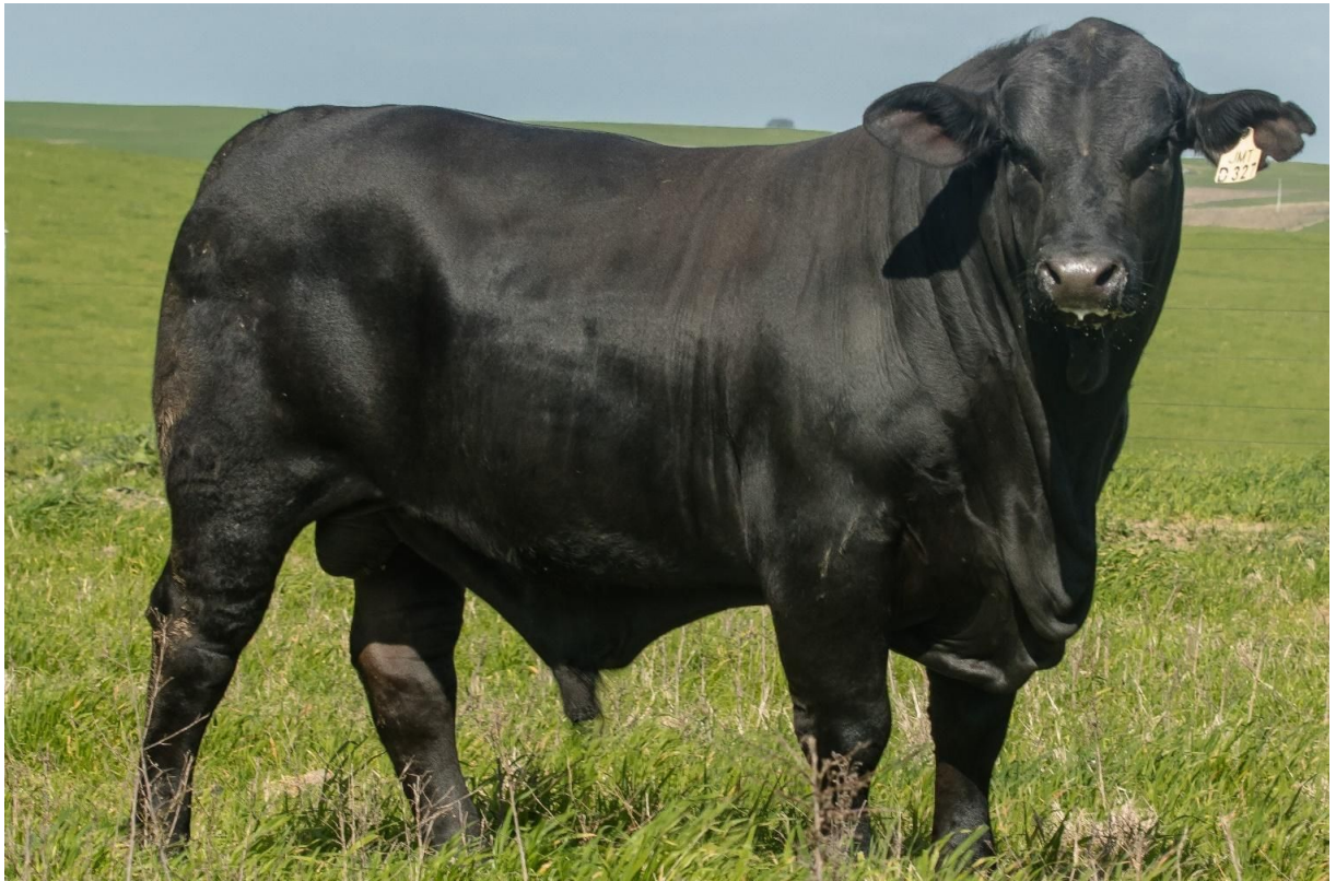
LOTE 42 - JMT D327 "ZAKYNTHOS" – Destacado filho de PACHÁ – Maior índice Bioeconômico de Carcaça do Leilão