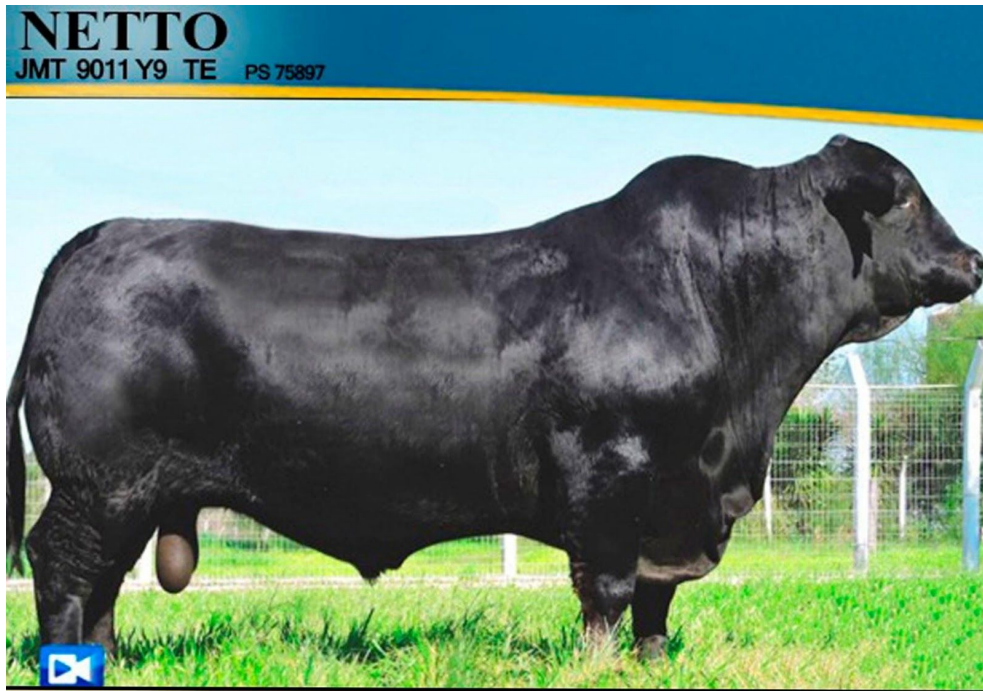
JMT Netto 9011Y9TE touro pai dos lotes 41, 4, 5, 6 e muitos outros.