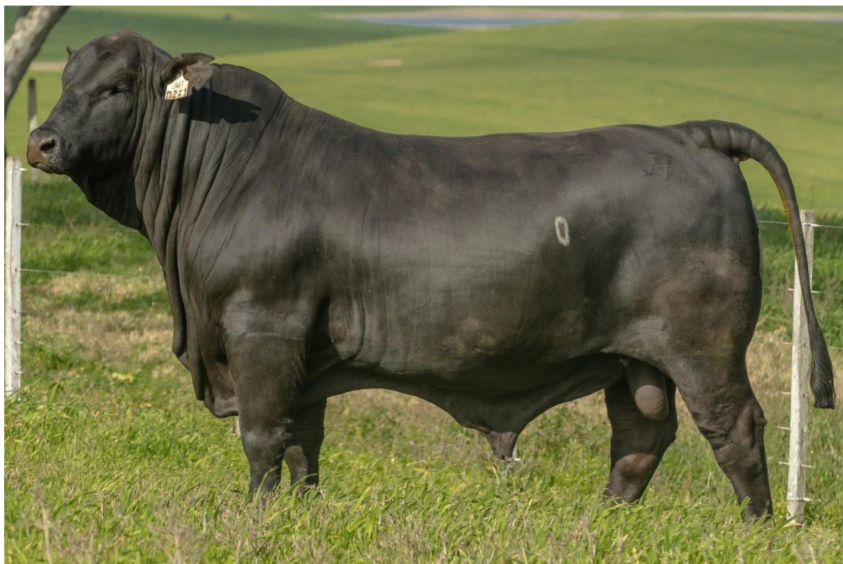
LOTE 41 – JMT D241 – Filho de JMT Netto mais bem avaliado. TOP 1% da raça.

Todos os touros em oferta são submetidos a exames andrológicos e clínicos que garantem a sua aptidão para o trabalho em suas vacas. O responsável pelos exames é o Med. Vet. Lorenzo Sperandio, que terá o prazer de esclarecer qualquer dúvida pelo tel. 055 3211-1011. Aconselhamos que, aos touros que façam viagens longas após o leilão, sejam proporcionados alguns dias de aclimatação e descanso antes de entrarem em serviço. Sua eficiência e bem-estar agradecem. Veja o Manual de Recomendações Básicas para os touros no final deste catálogo.