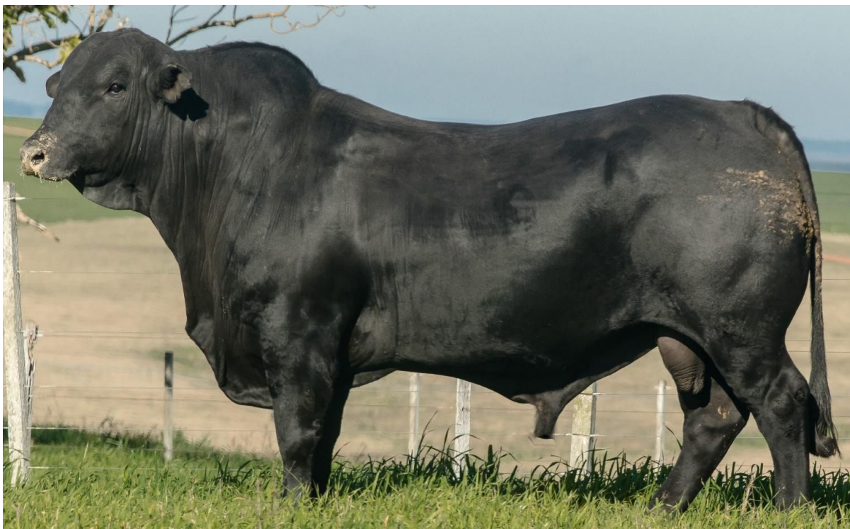
LOTE 3 - JMT C295 "MYKONOS" – Excelente grau de zebu com alta performance – DECA 1 para Índice Final.