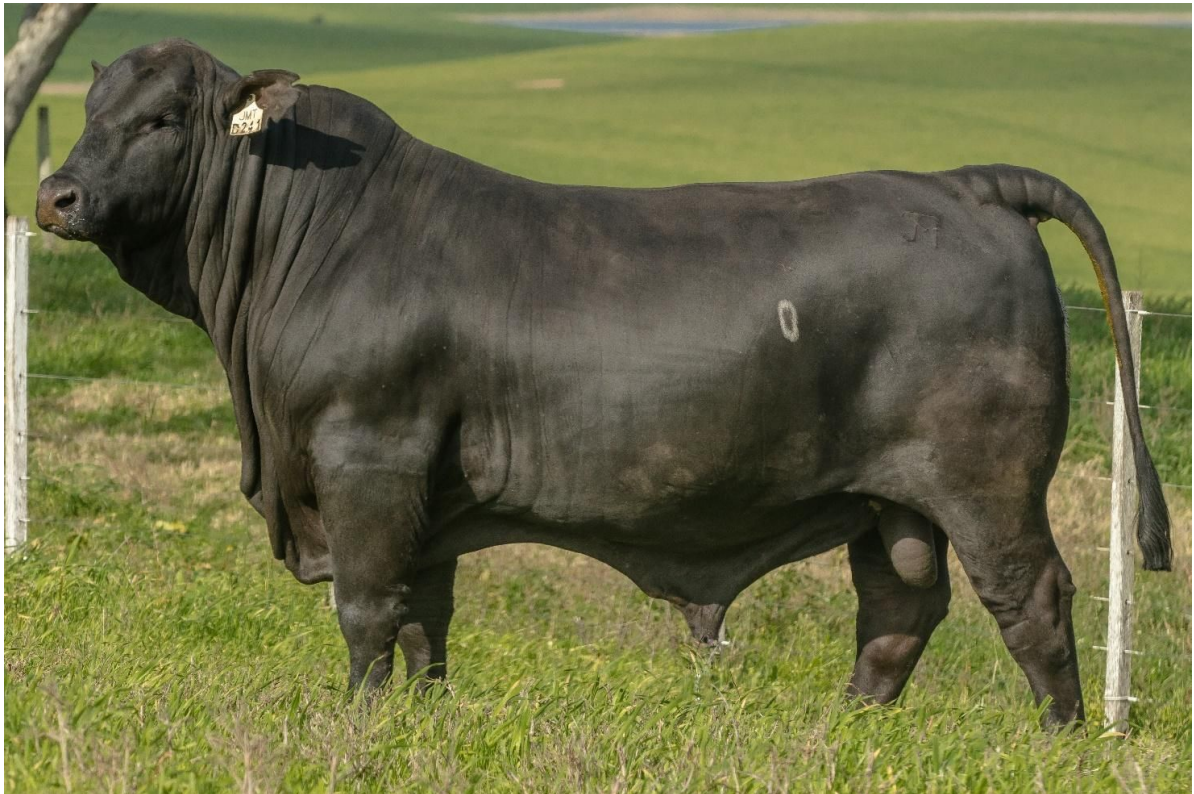
LOTE 41 - JMT D241 – Filho de JMT Netto mais bem avaliado. TOP 1% da raça.