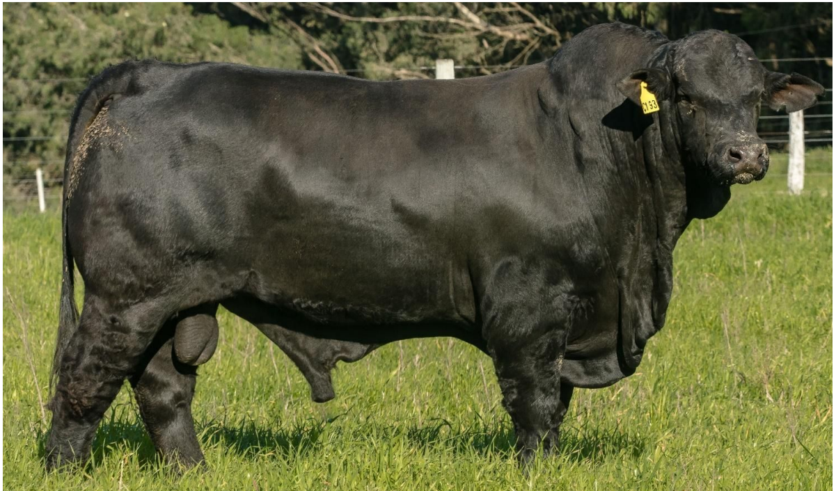
LOTE 2 - JMT C193 "SINATRA" – DECA 1 para Índice Final.