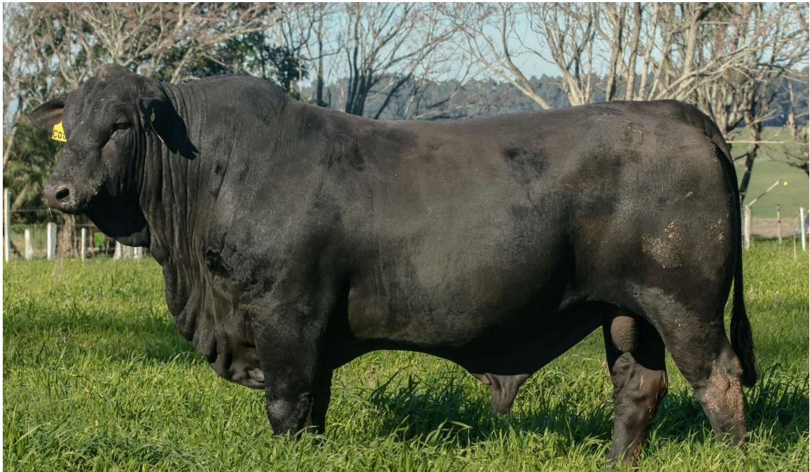
LOTE 1 - JMT C005 "PANTHEON" – Touro Jovem PROMEBO - DECA 1 em várias caract.